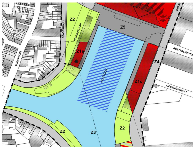
Figuur 2. Referentie: 135 RUP Oude Dokken – uittreksel grafisch plan.

De zone voor kaaien (Z5) laat alle werken toe die betrekking hebben op de aanleg, het beheer en het onderhoud van de vereiste kaaien, het aanwenden van de kaaien door of ten behoeve van het vaarverkeer, het gebruik als recreatieve ruimte voor fietsers en voetgangers, de groenaanleg. De zone moet zodanig ingericht worden dat er geen verkeer noch parkeren mogelijk is. De aanleg moet ruimte bieden voor fietsers en voetgangers.