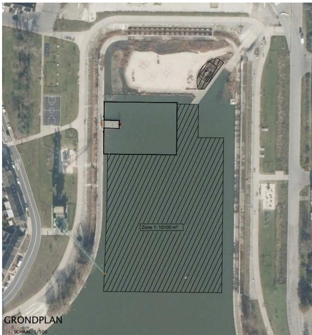
Figuur 1: Overzicht van de terreinen voor de uitbouw van de jachthaven (gearceerde stukken, oppervlakte is louter indicatief)

Volgende terreinen behoren niet tot de vermarkting en worden niet in concessie gegeven: